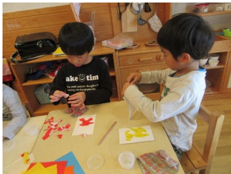
もも：年賀状製作の様子