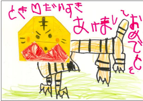
うめ…年賀状の作品