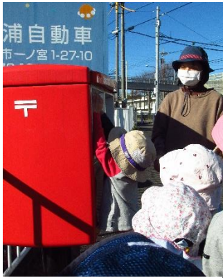
さくら：みんなでポストへ