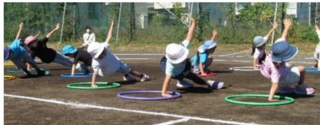
桜ヶ丘第一保育園：“おやこで遊ぼう”年長児のフープを使つての体操

今後も、法人職員が丸一となり、どのような環境下でも、子ども達や保護者の“心に寄り添える保育”を追求していきたいと思ひます。