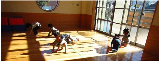
年末の大掃除*ホールの床を雑巾がけしてくれて、ピッカピカ！！

★お休みの連絡は、朝の9:15までにご連絡ください。児童の安否確認の観点から、連絡がない場合は、保育園から確認させていただく場合もあります。 ★保育園内への食べ物・飲料の持ち込みはご遠慮ください。(アレルギーのあるお子さんを守る為)