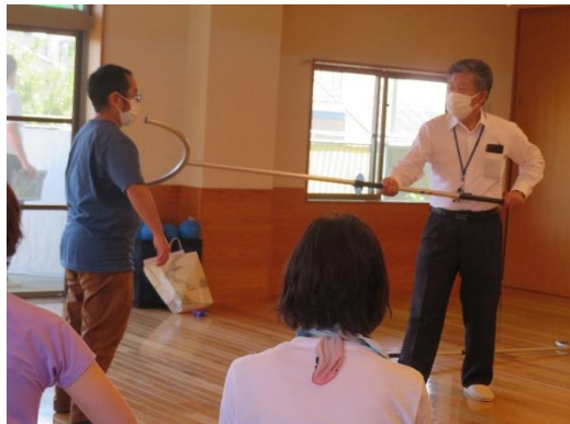
“さすまた”の使い方の様子

保育園では、職員の健康維持を目的に春の健診、産業医の支援を受けてのメンタルヘルスチェック、そして今回の体力の維持向上を目的とした体力測定（国士舘大学の協力の下）、心身共に健康の保持に努めています。健康体で子ども達と向き合えてこそ、良い保育が出来ると考え取り組んでいます。