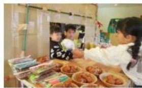
キッチンカー販売

私達をもっと保育をしやすい環境になるよう、法人理念である“子ども達の心に寄り添う保育”をめざし、職員一同、今年も取り組んでいきたいと思っています。