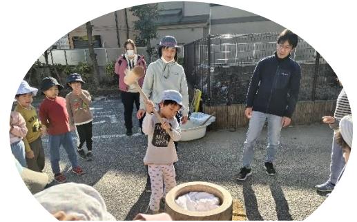
日本の文化は伝承していきたいですね。

『よいしょ、よいしょ』と、その掛け声に合わせて、みんな上手についていました。本当のもち米を使えなかったのが、来年は本当のお餅つきが出来るといいな。この日に鏡餅も準備できたので、1/10の“新年を祝う会”が楽しみですね。