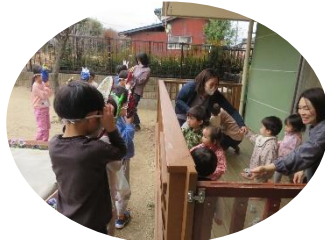
0歳のふたば・つぼみ組の小さな子には、投げられた豆を『はい！』と、手渡してくれる年長の優しい鬼さんも。