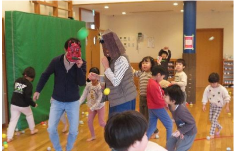
年長だけでも、豆まきを楽しんだよ！！