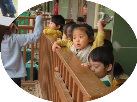
年長の鬼が乳児のクラスへ小さな子たちは、“おには～そと”と、新聞紙で作った豆を鬼にめがけて投げていました。