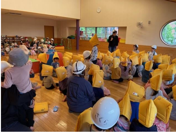
防災頭巾をかぶって、ホールに避難

昨年に引き続き、不審者対策のための訓練も、今年行う予定です。同じ日に、園として“防災会議”を持ち、緊急時の動きや役割分担などを確認しています。能登半島地震・台湾地震と大きな地震が続いています。子ども達の安全を確保するためにも日々備えています。